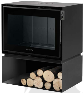
MONTMARTRE 800 C FR9011040B

Vous êtes libre de choisir l'esthétique qui vous plaît le plus parmi une vision XXL avec un grand bûcher , une vision XL avec bûcher , ou le pied central .