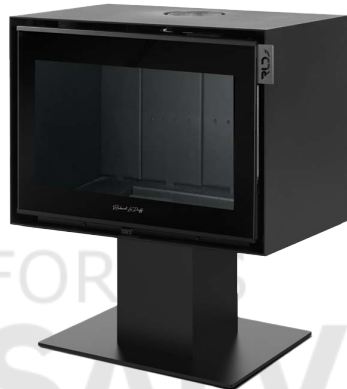
MONTMARTRE 800 P FR9011050B

Dimensions (L x H x P) : 76 x 92 x 51 cm