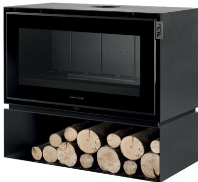
MONTMARTRE 1000 C FR9011070B Dimensions (L x H x P) : 100 x 92 x 51 cm

Dimensions (L x H x P) : 76 x 93,3 x 50,8 cm