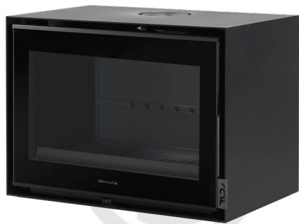
LE MARAIS MURAL 700 FR9011010B

À la recherche d'innovations esthétiques, ces poêles murales éveille l'originalité dans tous les décors . En étant suspendu, ces appareils offre la liberté de placement dans n'importe quelle partie de la pièce, permettant ainsi des options décoratives des plus originales . Le spectacle des flammes concilie avec succès l'efficacité du chauffage et le plaisir visuel, offrant une expérience unique où la fonctionnalité rencontre l'esthétique.