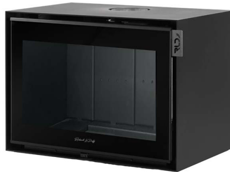
SAINT GERMAIN MURAL 800 FR9011020B

Dimensions (L x H x P) : 67 x 56 x 51 cm